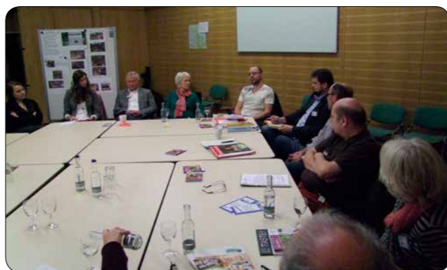
Diskussion in Arbeitsgruppe 2014

Jahr durchführt. Mit Kreativität soll der Faire Handel auch in Supermärkten erlebbar gemacht werden. Die Auszubildenden von Blume 2000 haben in ihrer Firma, in Zusammenarbeit mit Schulen, mit dem Weltladen, der Stadt Norderstedt und einem großen Einkaufszentrum mehrere Aktionen erfolgreich zum Thema ‚Blumen im Fairen Handel‘ durchgeführt. Die Auszubildenden von BLUME 2000 haben mit ihrem Projekt im Frühjahr 2015 den ersten Preis des Wettbewerbs 2014 (2500 €) gewinnen können.