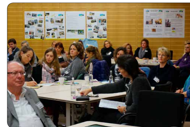
Eröffnungsplenum Netzwerktreffen 2014

Dies war der Ausgangspunkt für landesweite Netzwerktreffen der Fairtrade Towns in Schleswig-Holstein.