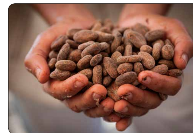
Kakao, Bildnachweis: TransFair e.V., Sean Hawkey