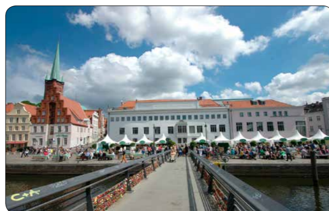
„Fair-Bio-Regional-Markt“ an der Obertrave beim Internationalen Hansetag in Lübeck, Mai 2014

2014 gelang es der Gruppe in Lübeck sogar, zusammen mit dem lokalen Stadtmarketing, auf dem Internationalen Hansetag eine Konferenz zu „Fairer Handel – Faire Hanse“ durchzuführen und zudem einen „ bio-regio-fair “-Markt auf die Beine zu stellen, inklusive eines Fairtrade-Brunchs für die Gäste der Stadt und die Lübecker_innen.