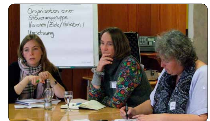
Diskussion in Arbeitsgruppe, Netzwerktreffen 2014

Weitergehende Informationen über die Initiative „citta slow“ finden sich im Internet unter: www.cittaslow-deutschland.de oder www.citta-slow.de