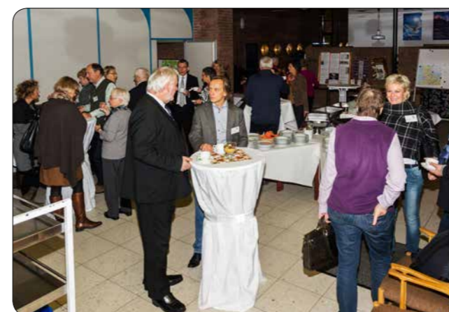
Diskussionen am Rande des Netzwerktreffens 2015 in Meldorf