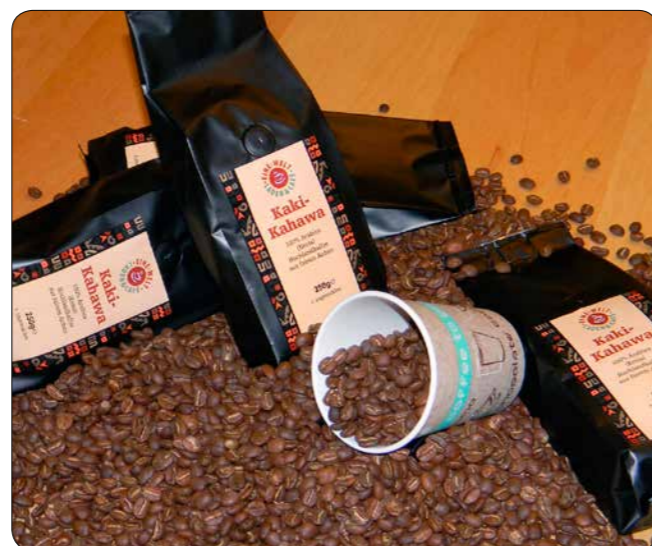
Der „Kaki-Kahawa“, der Kaltenkirchen-Kaffee, Bild: http://kedovo.blogspot.de/